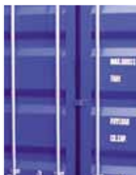
Дверь с резиновым уплотнителем

Контейнерная дизель-электростанция (КДЭС) представляет собой Термоизолированный контейнер, внутри которого установлена дизель-генераторная установка (ДГУ) (или система из нескольких, параллельно функционирующих ДГУ) и смонтированы все периферийные системы, обеспечивающие нормальное функционирование ДГУ: