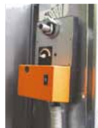
Автоматический привод управления вентиляционными