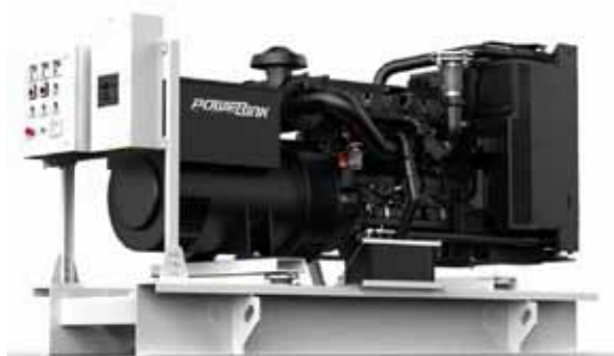
3-фазные электростанции, 400/230 В – 50Гц