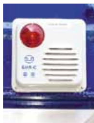
Датчик открытия дверей (опция)