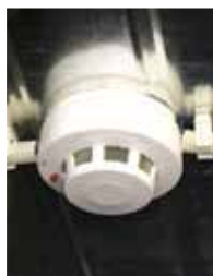
Датчик системы пожарной сигнализации